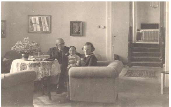
Denná izba v byte riaditeľa Figara