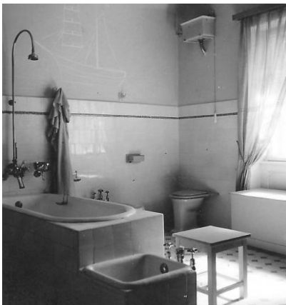
Kúpeľňa vyššieho štandardu