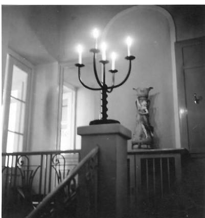
Vstup do riaditeľského bytu