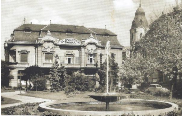
Budova Slovenskej banky v Trnave