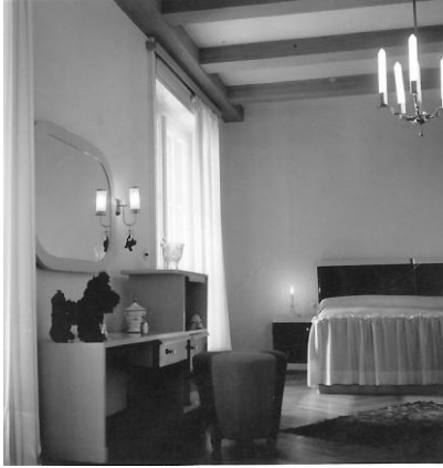
Spálňa rodičov v byte riaditeľa Figara