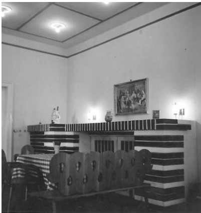
Hala s kazetovým stropom v byte riaditeľa Figara