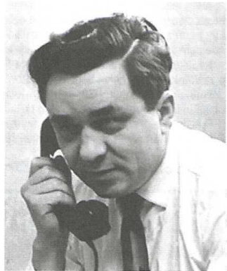
Gordon Arnold Lonsdale