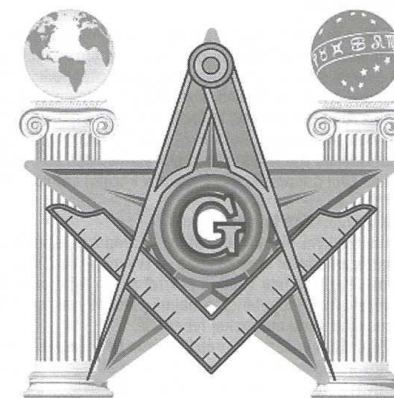
Slobodní zednáři. Logo

Slobodomurári zohrali kľúčovú úlohu v mnohých historických udalostiach, akými bola Francúzska revolúcia, proces zjedno-